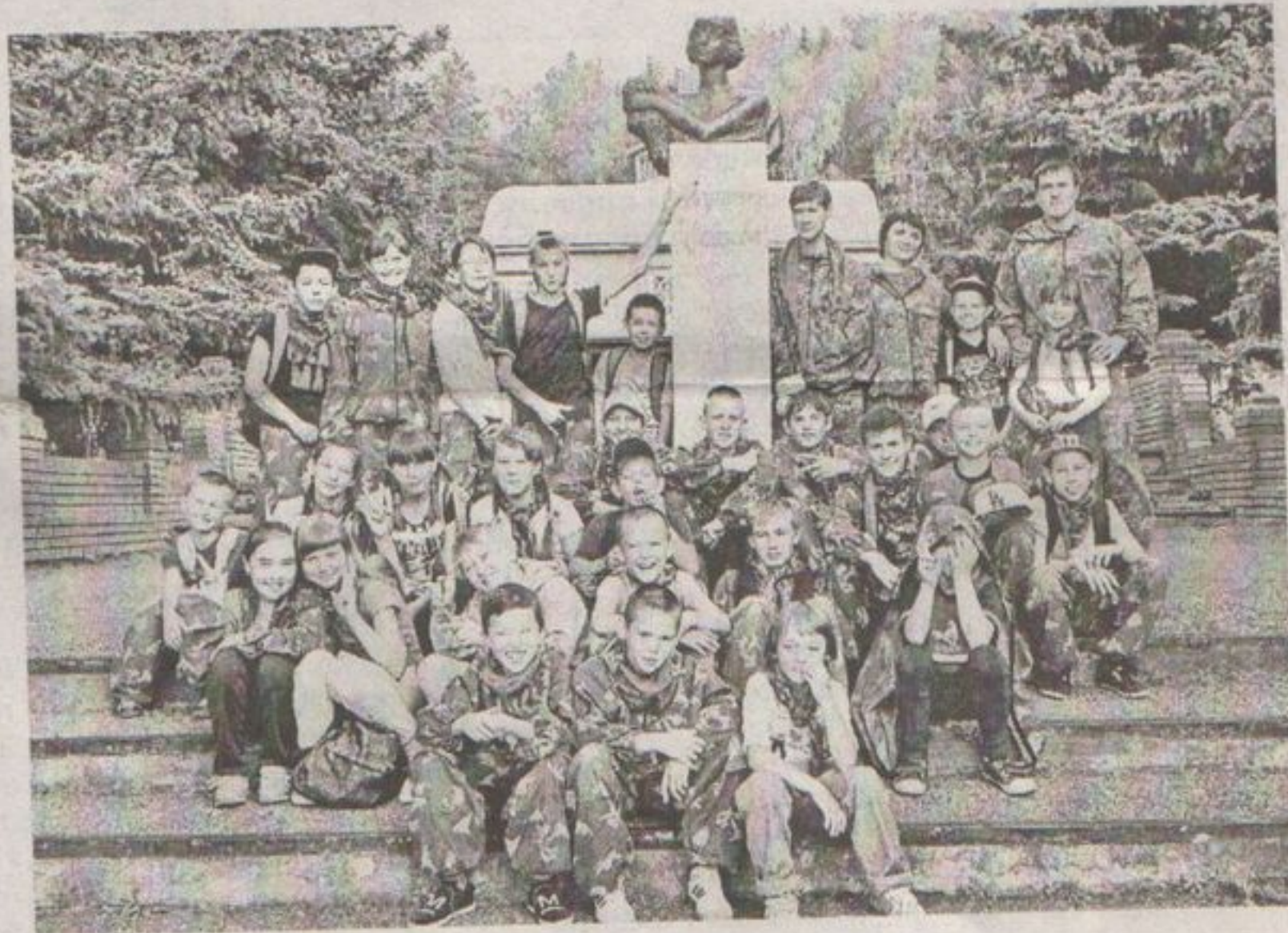
На экскурсии в Усень-Ивановском

В детском оздоровительном центре «Чайка» две недели работал военно-патриотический профильный лагерь «Юный патриот», в котором отдыхали тридцать школьников.