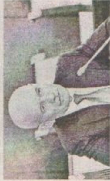
Глава республики Рустэм Хамитов выступил с инициативой проведения масштабной акции.

– Подписанный Президентом России Владимиром Владимировичем Путиным Указ о праздновании в 2019 году 100-летия образования Республики Башкортостан мы расцениваем как вызов союзу оценке достижений республики, труда ее жителей, как поддержку всей нашей работы, планов и начинаний, – сказал Рустэм Хамитов. – В честь этой знаменательной даты предлагаю реализовать масштабную республиканскую акцию «К 100-летию Башкортостана – 100 новых объек-